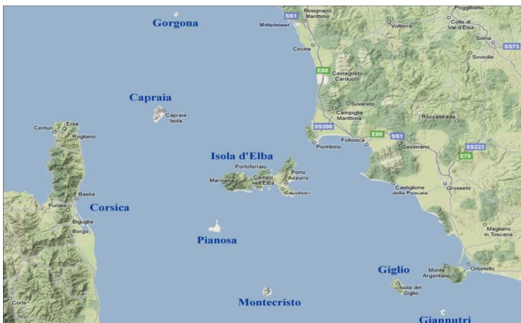
Fig. 1 – Inquadramento del territorio incluso nel Parco Nazionale Arcipelago Toscano

Il Parco Nazionale Arcipelago Toscano viene considerato il parco marino più grande in Italia e tra i più vasti del Mar Mediterraneo perché comprende sette isole, numerosi isolotti e scogli che emergono in ampio tratto di Mar Tirreno nel cuore del grande Santuario Internazionale per la protezione dei Mammiferi Marini "Pelagos", istituito come area marina internazionale tutelata nel 1999.