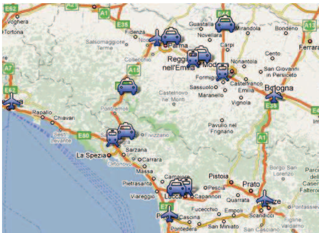
Fig. 2 - Localizzazione delle stazioni ferroviarie, aeroporti e caselli autostradali rispetto al Parco