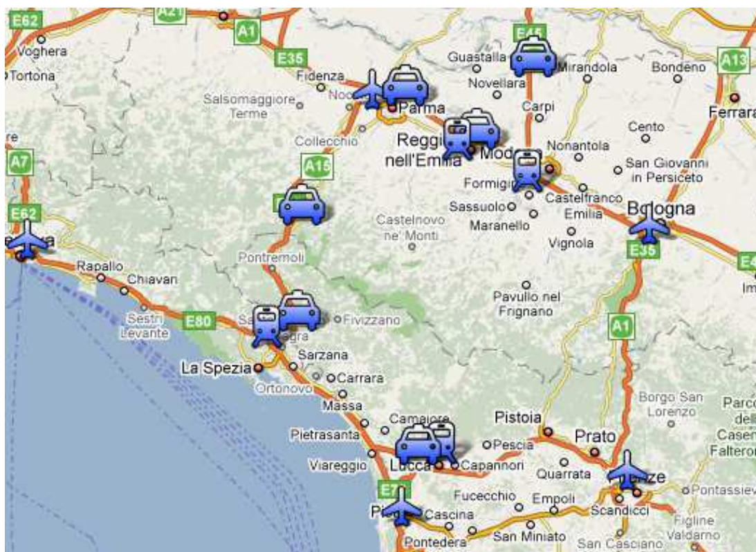
Fig. 2 - Localizzazione delle stazioni ferroviarie, aeroporti e caselli autostradali rispetto al Parco