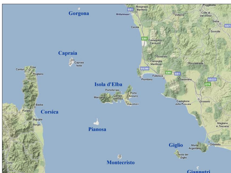
Fig. 1 – Inquadramento territoriale del territorio incluso nel Parco Nazionale Arcipelago Toscano

Il Parco Nazionale dell'Arcipelago Toscano viene considerato il Parco marino più grande del Mediterraneo perché comprende sette isole, numerosi isolotti e scogli che emergono in ampio tratto di Mar Tirreno nel cuore del grande Santuario dei Cetacei, Pelagos, istituito come area marina internazionale tutelata nel 1999.