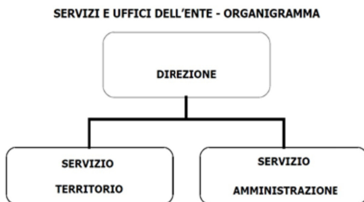
Fig. 2 – Assetto organizzativo dell'Ente nel 2019

A seguito del Decreto del Presidente del Consiglio dei Ministri 23.01.2013 concernente la rideterminazione effettuata in attuazione delle disposizioni dell'art. 2 del decreto legge 6 luglio 2012, n°95 convertito dalla legge 7 agosto 2012, n°135 è stata definita la dotazione organica dell'Ente che prevede, oltre al direttore, n°21 unità di personale dipendente così distribuito: