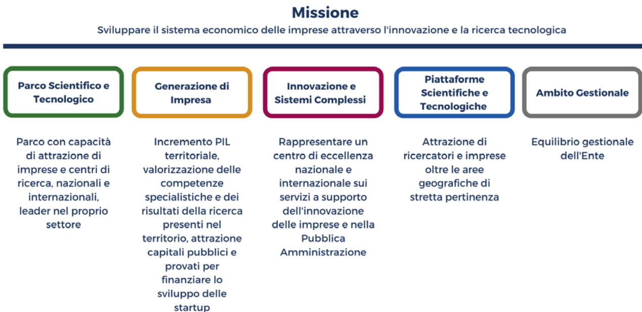
Fig.5 - Segmento dell'Albero della performance relativo a missione, aree strategiche e outcome

Dal modello teorico discende l'applicazione sugli effettivi ambiti di intervento su cui l'Ente intende operare, ovvero le aree strategiche di cui al precedente capitolo1: Si riporta di seguito una rappresentazione dell'albero della performance nella quale sono indicate le aree strategiche declinate in base agli outcome attesi.