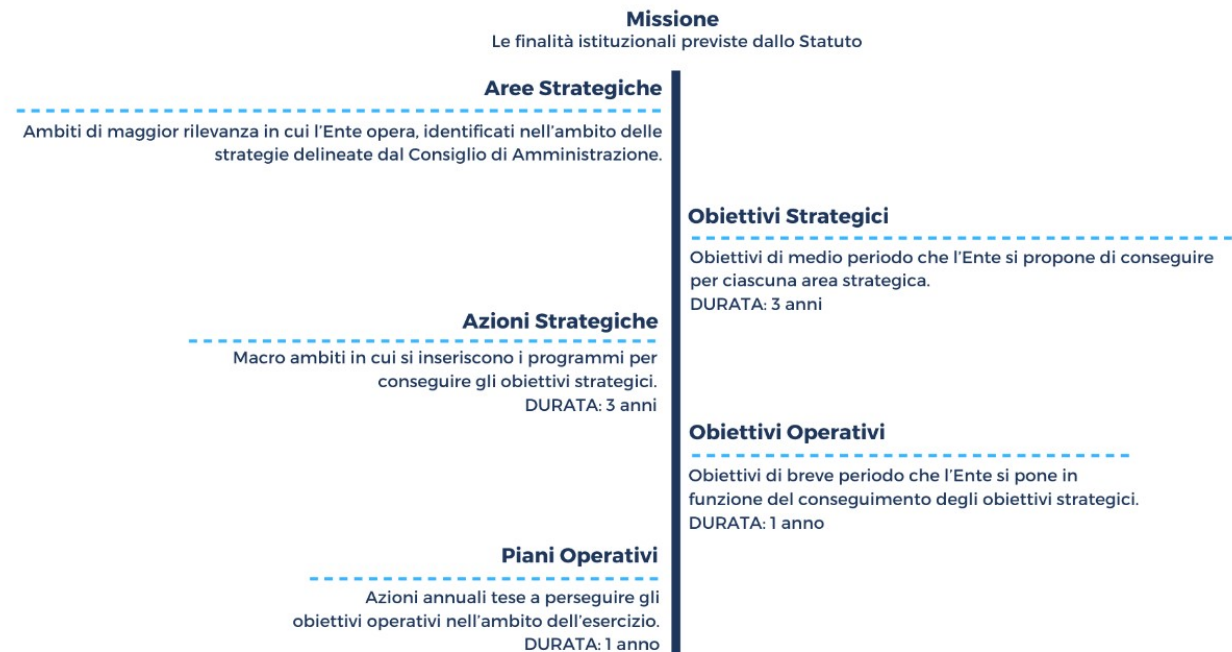
Fig. 4 – Albero della performance

Dal modello teorico discende l'applicazione sugli effettivi ambiti di intervento su cui l'Ente intende operare, ovvero le aree strategiche di cui al precedente capitolo1: Si riporta di seguito una rappresentazione dell'albero della performance nella quale sono indicate le aree strategiche declinate in base agli outcome attesi.