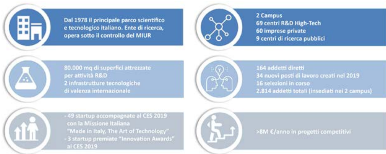
Fig. 3 – Dati per aree di attività

Ulteriori informazioni sulle attività dell'Ente sono evidenziate nell' allegato 2 – L'Amministrazione in cifre , in cui sono riportati alcuni indicatori significativi in ordine all'organizzazione e alle attività che caratterizzano l'Ente.