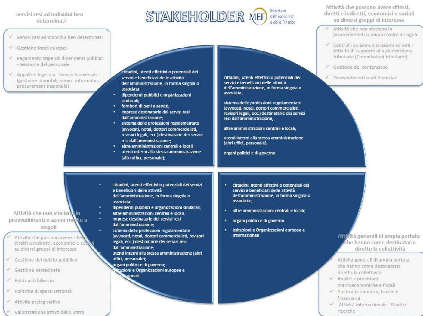
Figura 2 – Mappa degli stakeholder del MEF