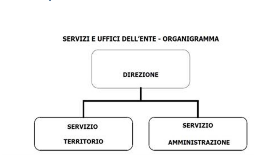
Fig. 2 – Assetto organizzativo dell'Ente nel 2023

A seguito del Decreto del Presidente del Consiglio dei Ministri 23.01.2013 concernente la rideterminazione effettuata in attuazione delle disposizioni dell'art. 2 del decreto legge 6 luglio 2012, n°95 convertito dalla legge 7 agosto 2012, n°135 è stata definita la dotazione organica dell'Ente che prevede, oltre al Direttore, n°21 unità di personale dipendente così distribuito (alla data del 31.12.2021):