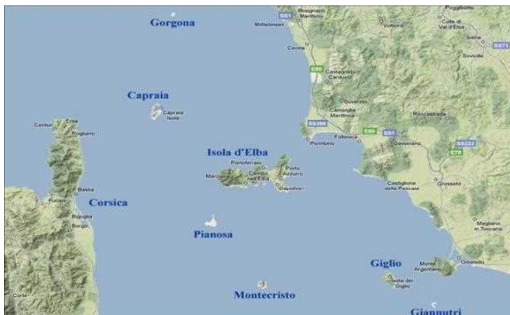
Fig. 1 – Inquadramento del territorio incluso nel Parco Nazionale Arcipelago Toscano