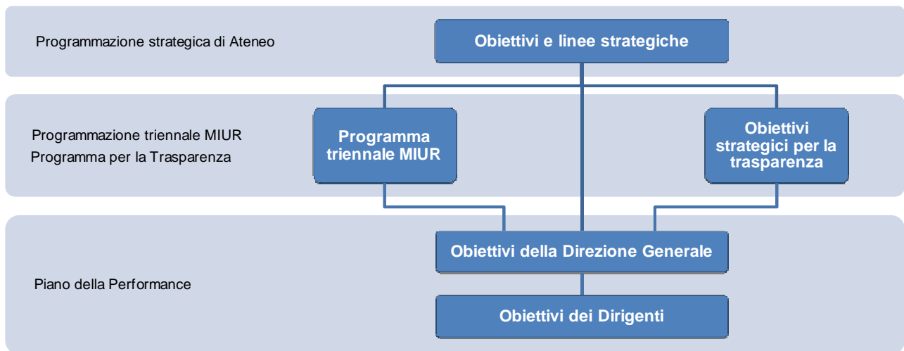
Figura 3 - Albero delle performance dell'Università di Padova

Prima di presentare gli obiettivi della Direzione Generale e dei Dirigenti, e considerando quanto precedentemente illustrato, si riporta lo schema sintetico dell'albero delle performance dell'Ateneo di Padova, che evidenzia la struttura degli obiettivi dell'Università.