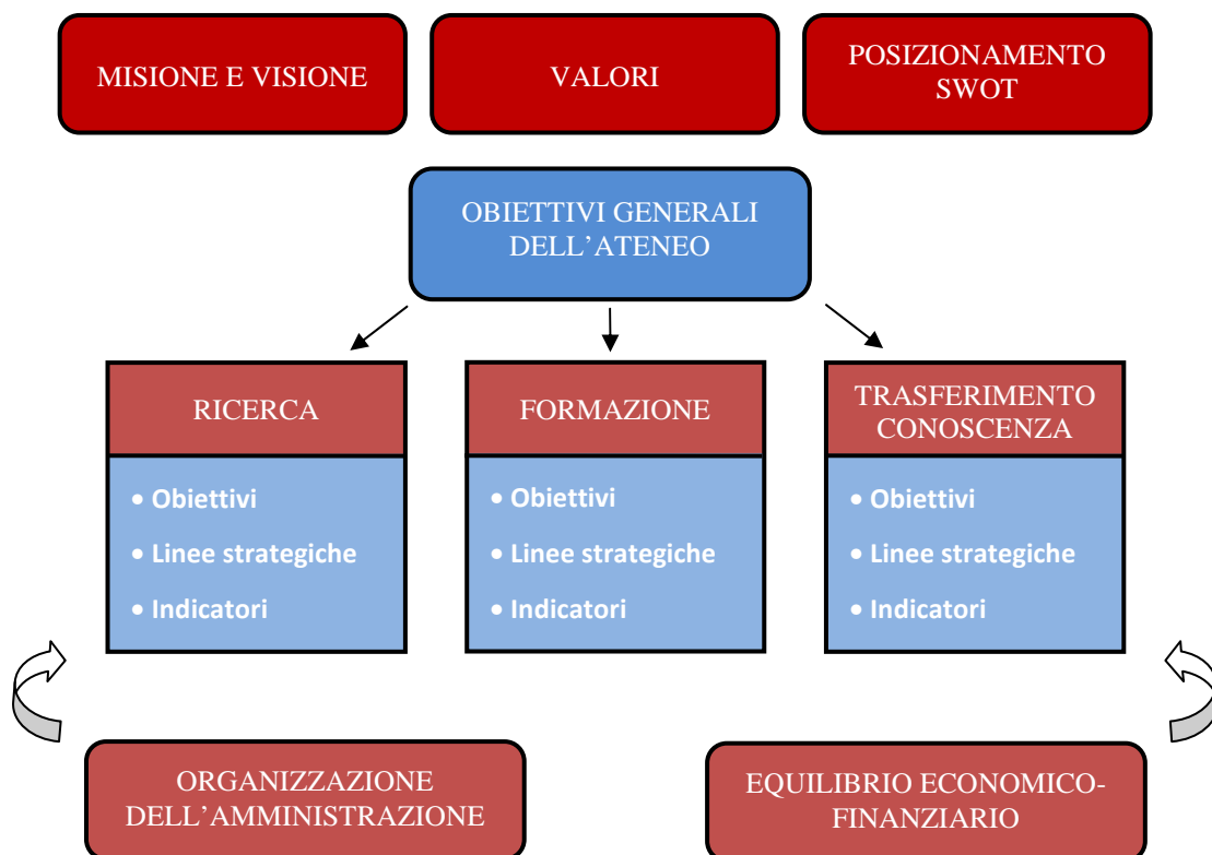
Figura 2 - Struttura sintetica del documento Obiettivi e Linee strategiche dell'Università di Padova

Il documento Obiettivi e linee strategiche dell'Università di Padova è strutturato come descritto nella figura 2: