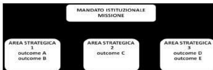
Tavola 1 - L'albero della performance: il collegamento fra mandato istituzionale-missione e aree strategiche:

Nella rappresentazione grafica dell'albero della performance, le aree strategiche sono state articolate secondo il criterio dell'outcome e tenendo presente le finalità dell'Ente, secondo quanto riportato dalla Legge 394/91. Questa scelta è motivata dall'opportunità di rendere immediatamente intellegibile agli stakeholder la finalizzazione delle attività dell'amministrazione rispetto ai loro bisogni e aspettative e di definire prioritariamente le azioni lungo le "corsie istituzionali" predefinite.