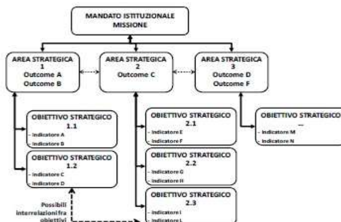
Tavola 2 –Esempio di albero della performance: il collegamento fra mandato aree strategiche e obiettivi strategici:

Agli obiettivi strategici sono associati uno o più indicatori, avendo cura che nel loro complesso tali indicatori comprendano tutti gli otto ambiti di misurazione e valutazione della performance. Per ogni obiettivo strategico si devono specificare, in maniera sintetica, le risorse finanziarie complessivamente destinate al raggiungimento dell'obiettivo.