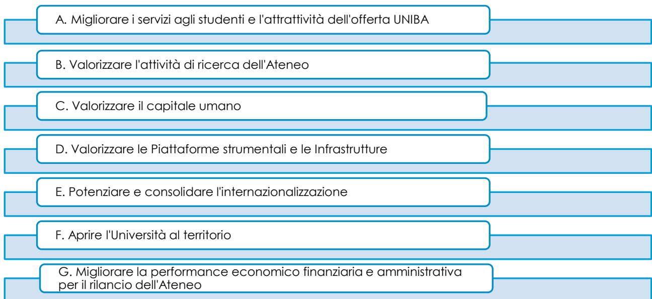
Fig. n. 2 – Le priorità Politiche individuate dall'Ateneo

Le priorità politiche coinvolgono trasversalmente le 4 ambiti strategici: Didattica, Ricerca, Terza Missione e Amministrazione (Figura 3).