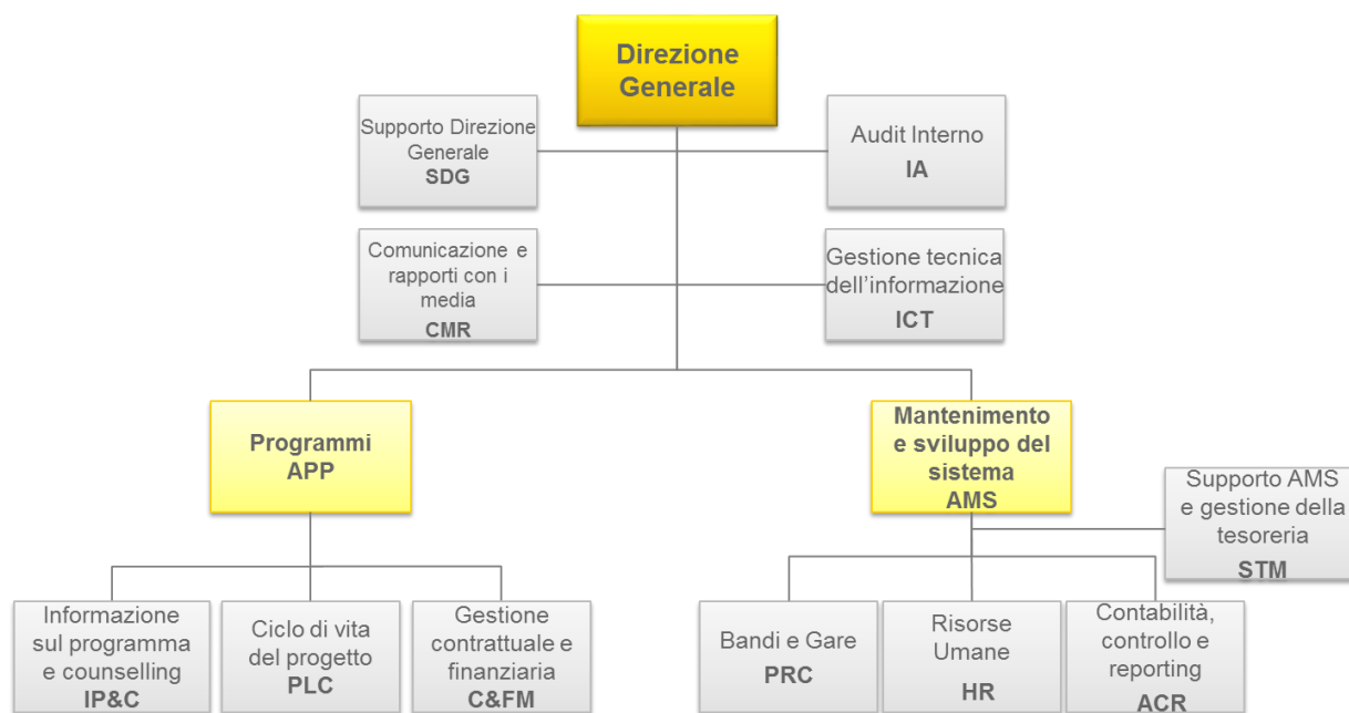
Figura 1 - Organigramma dell'ANG al 31/12/2017

L'organigramma dell'Agenzia al 31/12/2017 è di seguito riportato: