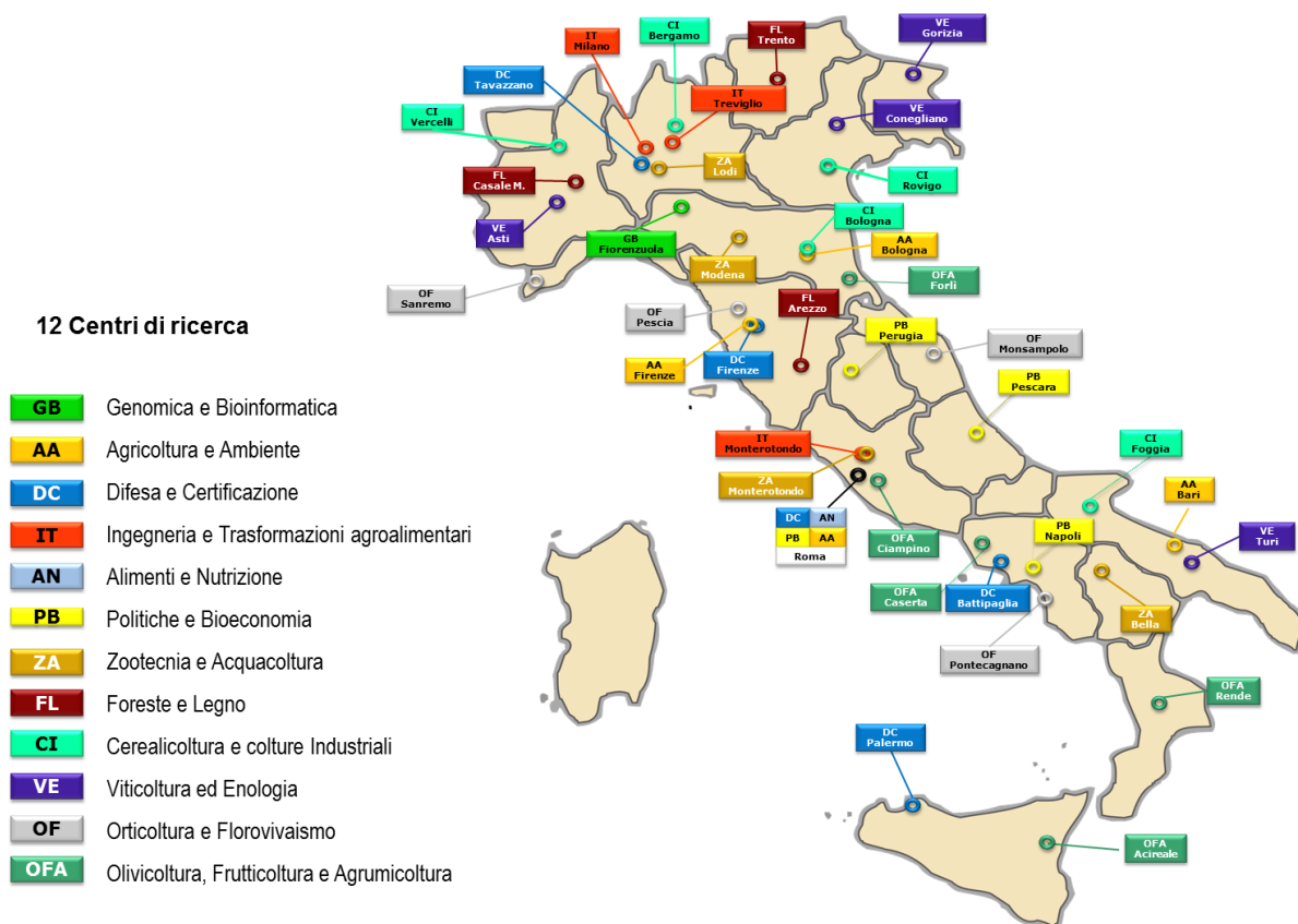
Figura 1: Dislocazione dei Centri di ricerca

La figura 1 illustra la dislocazione, sul territorio italiano, dei 12 Centri di ricerca.