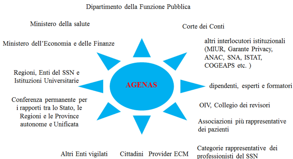
Figura 1 – I principali portatori di interesse di AGENAS