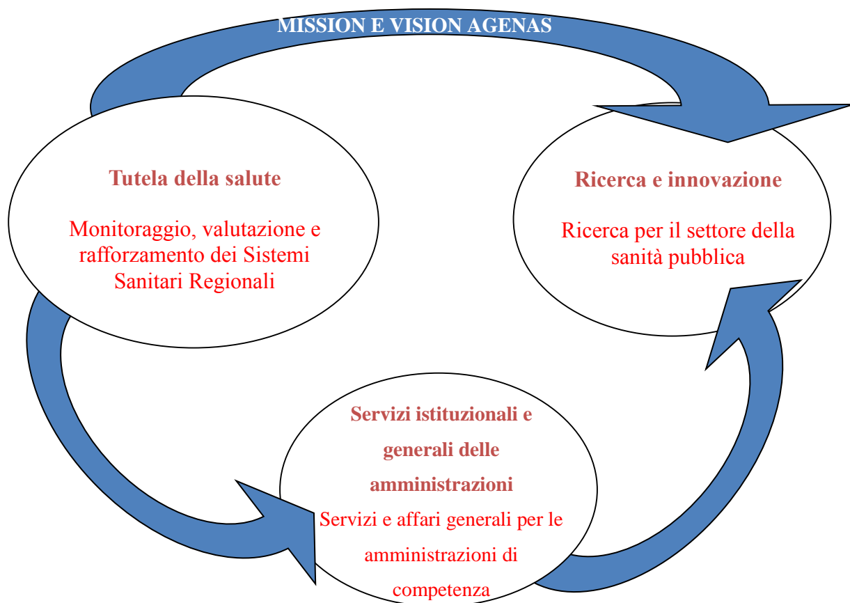
Figura 2 – Missionistituzionale di AGENAS