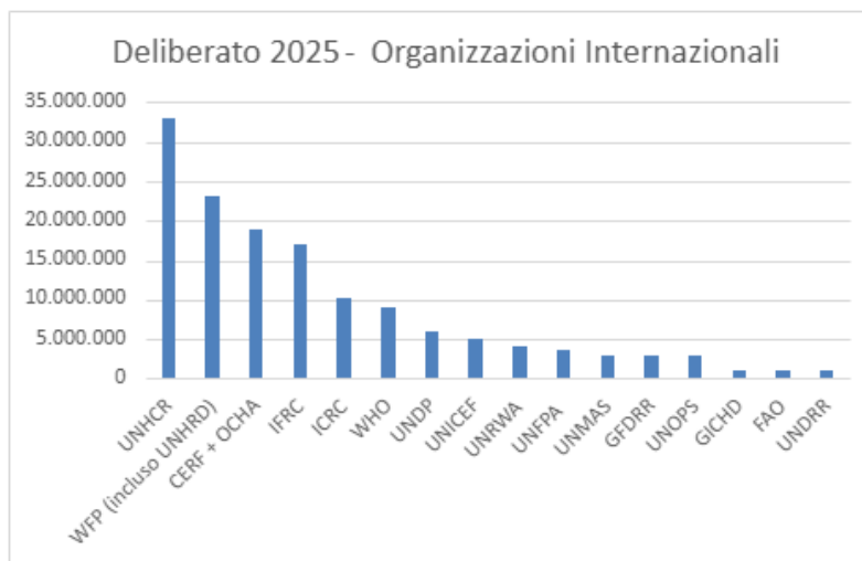
FIGURA 2 - INIZIATIVE DELIBERATE NEL 2025 PER ORGANIZZAZIONE INTERNAZIONALE

L'ammontare complessivo dei fondi deliberati è stato di 132,7 milioni di euro, pari al 60% del totale dei finanziamenti, distribuiti come da tabella seguente: