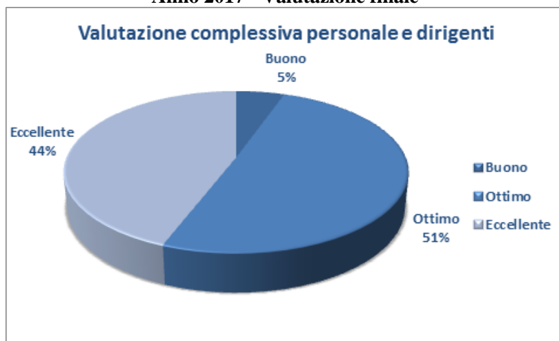
Tavola Personale Agenzia: fasce di valutazione Anno 2017 - Valutazione finale

Nella tavola seguente, è riprodotto un grafico che illustra la distribuzione del personale ACT, dirigente e delle aree funzionali, tra le diverse fasce di merito previste dal sistema di valutazione dell'Agenzia.