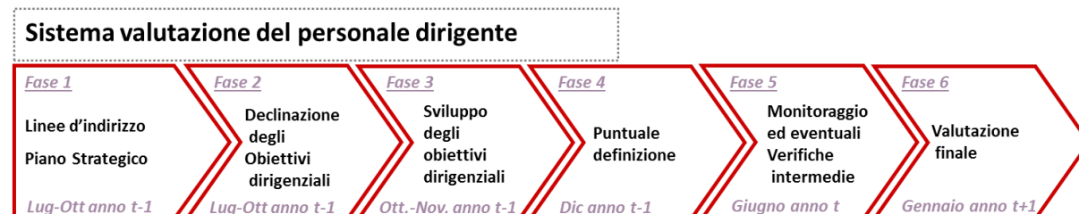
Figura 5: Fasi del sistema di misurazione e valutazione della Performance dei dirigenti – obiettivi anno t

Come detto in precedenza, di seguito, vengono sviluppate ulteriormente le fasi riguardanti il processo di misurazione e valutazione della performance dei dirigenti e del personale non dirigente, descritte nei successivi paragrafi.