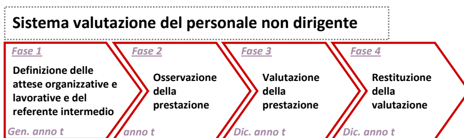
Figura 6: Fasi del sistema di misurazione e valutazione della Performance del personale non dirigente – anno t