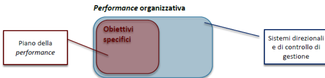
Figura 3 – Piano con minore selettività degli obiettivi