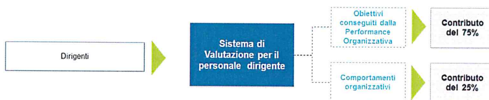
Figura 7: Performance individuale del personale dirigente