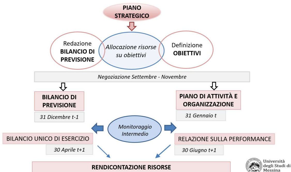
Flow-chart delle fasi del processo di integrazione tra performance e budgeting

Si riporta di seguito uno schema esemplificativo del modello di integrazione proposto.